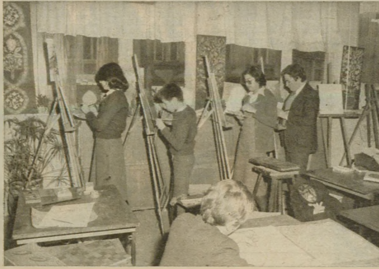
RESİM dersleri tam bir atelye çalışması halinde geçer. Bu da gençlerin yeteneklerini ortaya koymalarına büyük ölçüde yararlı olmaktadır...

«Şişli Terakki Lisesi öğrencileri, okul marşlarında da içtenlik ve coşkuyla her zaman tekrarladıkları (... Atam izinde yürümektir andımız / Türk genci olmaktadır şeref ve şanımız / Terakki yoludur ilk hedefimiz /) dizeleriyle heyecanlanmakta ve Atalarının güvencine layık olma azim ve kararında bulunmaktadırlar.»