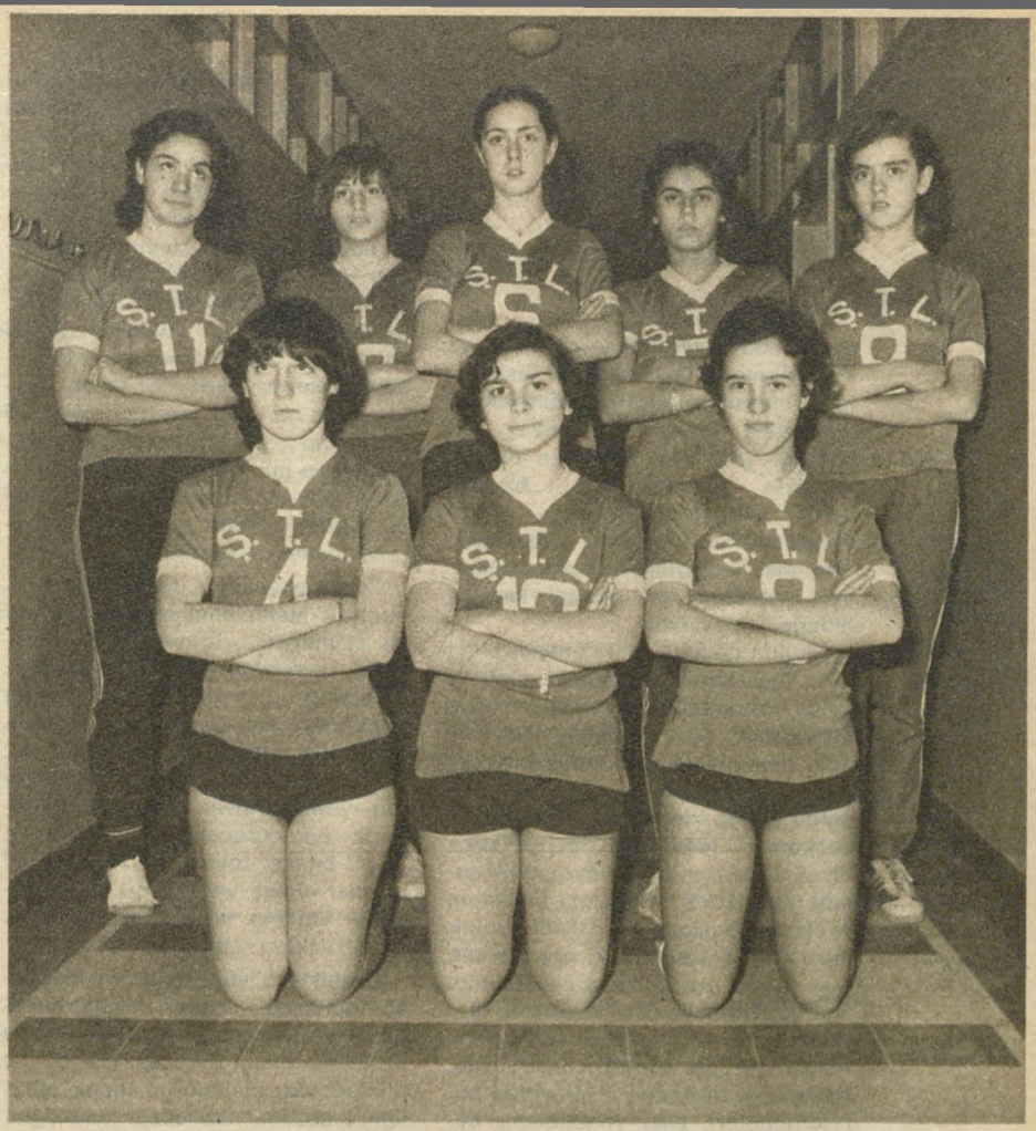
BASKETBOL takımı lisenin başarılı spor ekiplerinden biri. Yetiştiricileri başka okullarla yaptıkları maçlardan aldıkları sonuçlardan memnun.