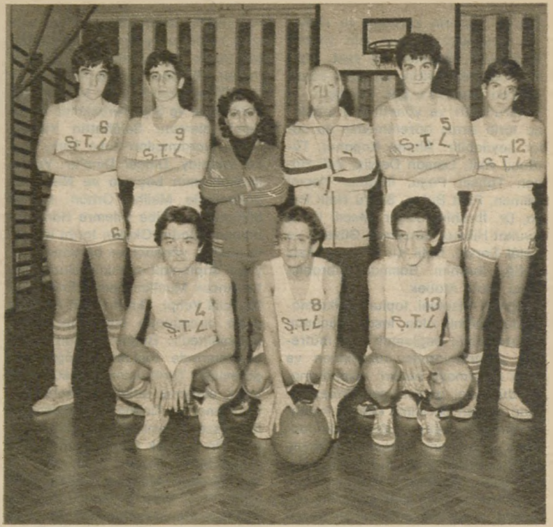
VOLEYBOL takımı da kızlardan oluşan basketbol takımı kadar başarılıdır. Takım, öğretmenlerinin gözetiminde devamlı olarak maçlara hazırlanır.

— Sanayileşen toplumun gereksinmesi olan insan gücünün ve üretici insanın geniş ve sağlam bir fen eğitimiyle yetişeceğine olan inanca Şişli Terakki Lisesi, fen eğitimin-