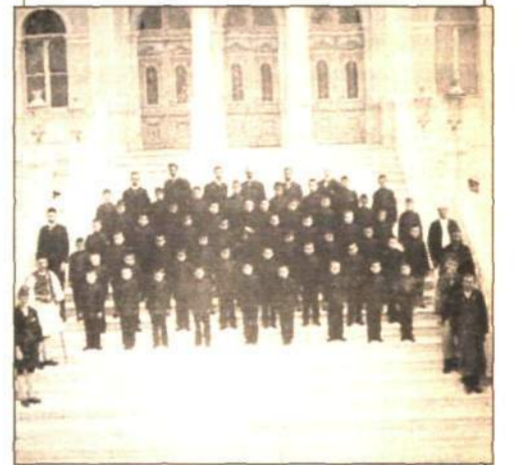
Selanik'teki modern okullardan birisi