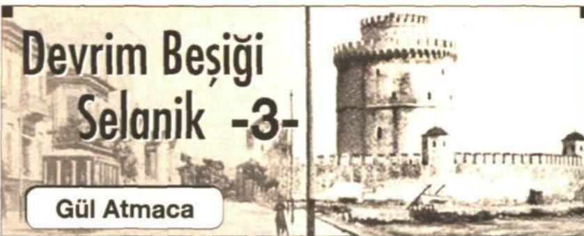
Devrim Beşiği Selanik -3-

Topkapı Sarayı'na kapıcıbaşı olarak girdi. Sevi din değiştirmiş olsa da taraftar bulmaya devam etti. Örneğin 1683'te 300 kadar Selanikli Yahudi, Sevi'nin ilk takipçilerine katıldı. M. Danon, "Tarih ve Toplum" dergisinin Aralık 1997 tarihli sayısındaki makalesinde, Sabetaycıların, Selanik'te Türkler tarafından Dönme, Yahudiler tarafından "Maaminim" (inanırlar) sınıfları ile çağrıldıklarını yazıyor.